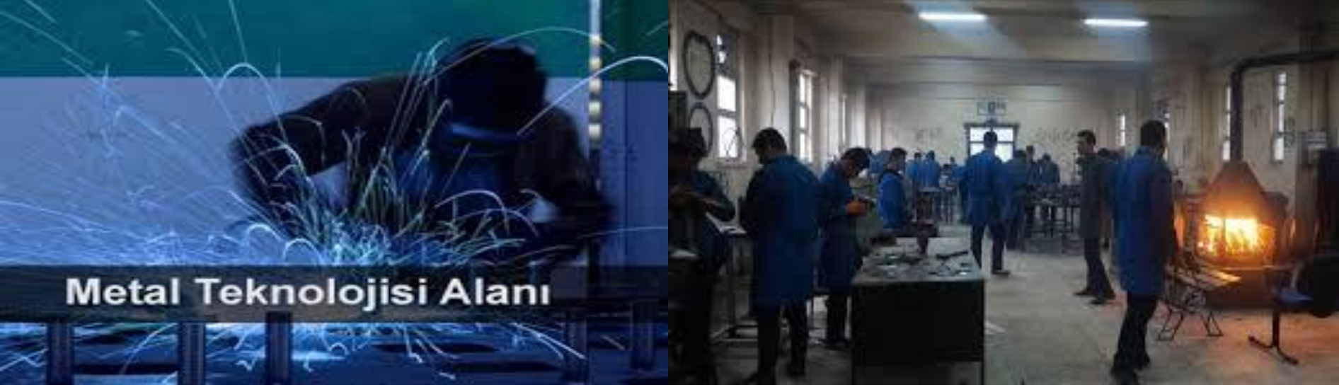
Metal Teknolojisi Alanı